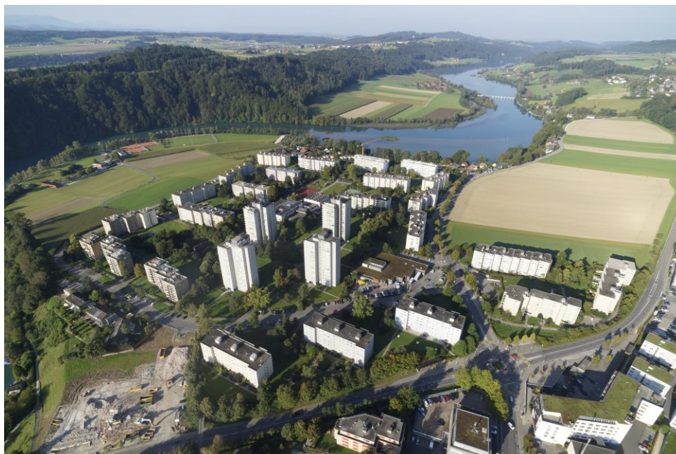
Der Wärmeverbund Kappelenring nutzt Seewasser als Energiequelle.